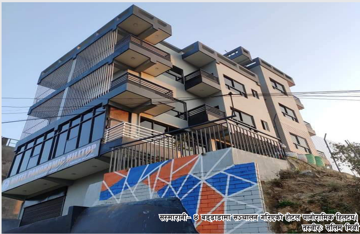
ससुराराणी-४ बड्डाडामा सञ्चालन गरिएको होटल पानोरामिक हिलटप।